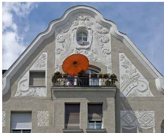
Dirk Wohltorf: „Wohneigentum der beste Weg zu einer kapitalgedeckten Altersvorsorge.“

Im bundesweiten Durchschnitt sind 52 Prozent der Bevölkerung Eigentümer. In Westdeutschland besitzen 56 Prozent der Bevölkerung ein Haus oder eine Eigentumswohnung und weitere 19 Prozent haben bereits darüber nachgedacht sich Wohneigentum zuzulegen. Im Osten Deutschlands sind es 36 Prozent, die Wohneigentum besitzen und 20 Prozent, die schon darüber nachgedacht haben. „Zwar ist die Leistbarkeit einer eigenen Immobilie im Osten höher, dennoch hatte die Bevölkerung im Osten weniger Zeit für den Vermögensaufbau. Die Angleichung an die Westquote beim Immobilienbesitz bleibt weiterhin eine Herausforderung“, so Wohltorf.